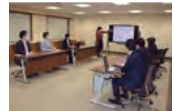
プロジェクト会議の様子