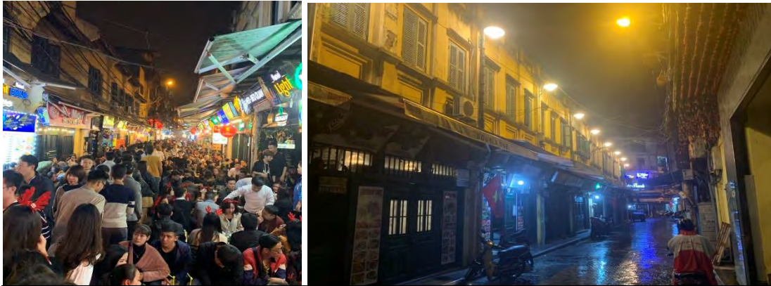
<ハノイ市旧市街>外国人観光客が多い Ta Hien 通り 左：コロナ禍前 右：現在 >

ベトナムの総観光収入のうち、海外からの観光客関連の収入は約55%を占めており、政府主導のもと力を入れている観光事業は深刻な影響が出ています。特に、観光地におけるホテル業・飲食店・娯楽等の業種は、観光客の減少により、廃業せざるを得ない企業も多く発生しており、観光の再開へ向けた早期の対応について政府内でも協議が行われています。