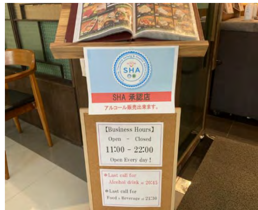
【SHA認定を取得した日本食居酒屋】

まだSHA認定を取得しているレストランは多くありませんが、ワクチンの普及とともに取得店舗が増えることが見込まれます。今後、懇親会もできるようになり、タイ国内のコミュニティが活発化されていくことが楽しみです。