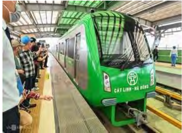
【ハノイ市メトロ走行車両（中国製）】

しかしながら、当初計画では2016年開業予定であったものが度重なるトラブル続きで延期延期延期……。延期のニュースが入る度に「またか…」と思っていた日がとても懐かしく感じます。私のベトナム駐在中にはお目にかかれなかったと思っておりまして、いざ開業となると喜びもひとしおです。市内の交通渋滞が問題化している中で、市内と郊外を結ぶ、新しい交通手段として活用されることに期待します。