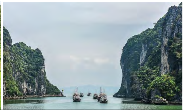
<著名観光地> 左：サパの棚田(ラオカイ省) 右：世界自然遺産ハロン湾(クアンニン省) >