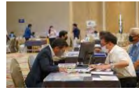
2020年FBCバンコクウェブ商談会の様子