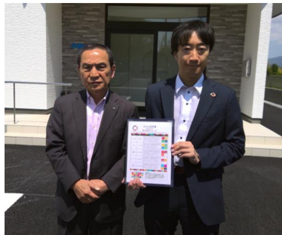
宣言書を手にする夏原社長（右）と赤津会長