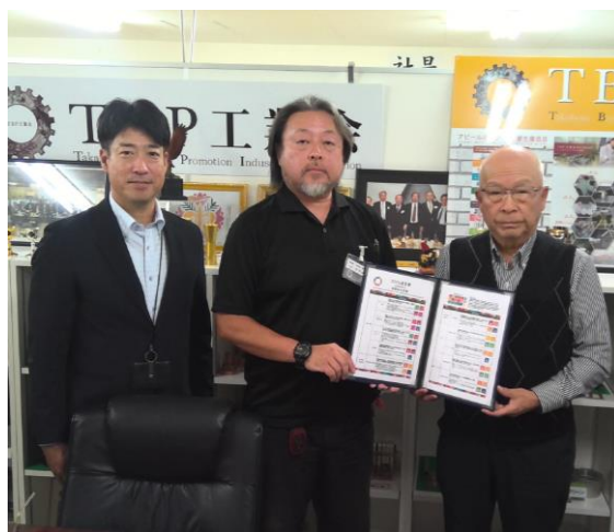
宣言書を手にする青野社長（中央）と青野会長（右）