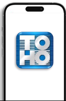
①東邦銀行アプリをダウンロード