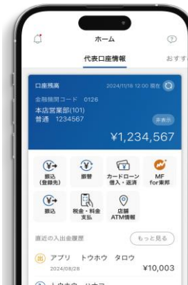
③最後にとうほうIDでログインして利用開始

アプリの手順に従ってとうほうIDを登録ください。すでに登録済みの方は手続き不要です。