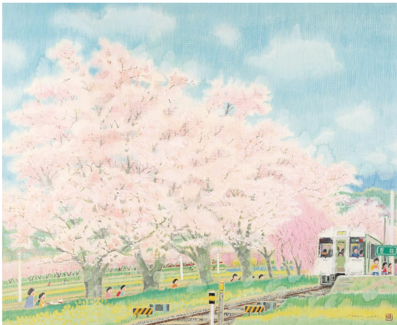
藤正機「夏井駅カラ千本桜が見エル」