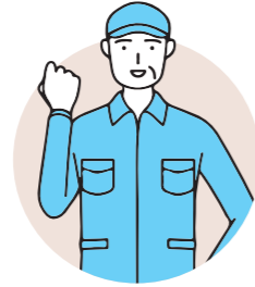
脱炭素経営診断レポート・サンプル